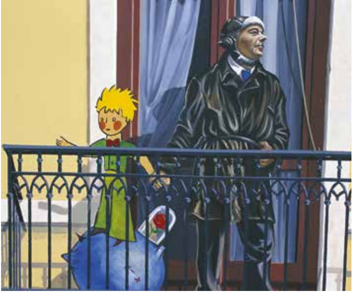
© Michel Djaoui & Eric Bernath

Traboules of the Croix-Rousse hill and the famous people of Lyon mural